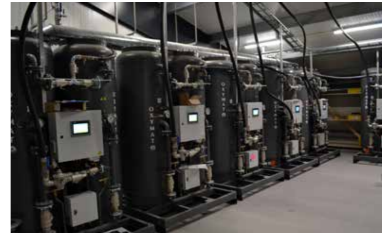
Støðin hevur egna iltgerar, tí iltinnihaldi í vatninum er so avgerandi fyri trivnað og vøkstur

Kapasiteturin hjá einum bio-reinsiverki verður roknaður eftir, hvussu nógv fóður tú kanst koyra í kørini, sum fiskurin so etur, og so skal bio-reinsiverkið klára at