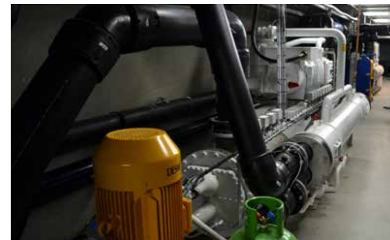
Teir størstu kompressararnir eru 700 kW og verða brúktir at køla vatnið í kørunum, har smoltið gongur, beint áðrenn tað fer á sjógv