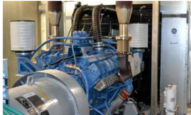
Á støðini eru 15 neyðstreymsgeneratorar – fimm teir størstu við einum kapasiteti á 1200 amperur hvør