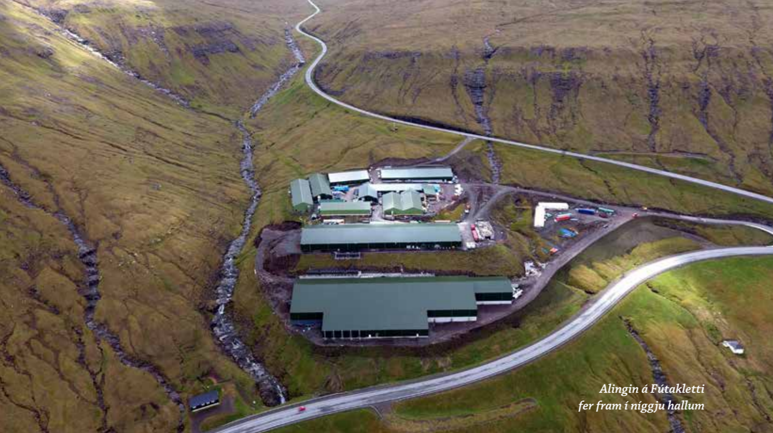
Alingin á Fútakletti fer fram í níggju hallum