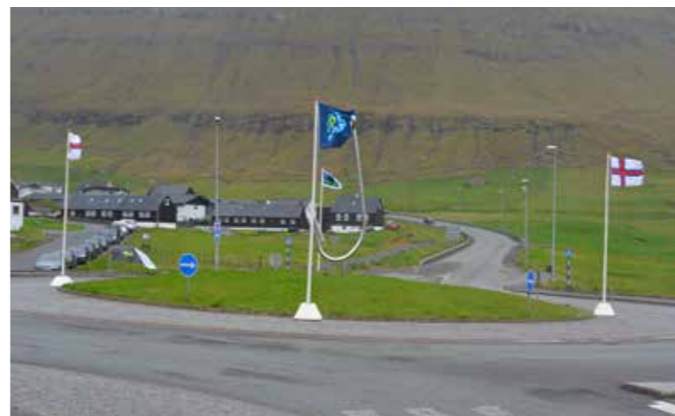
Klaksvík var vertur fyri Fish Fair