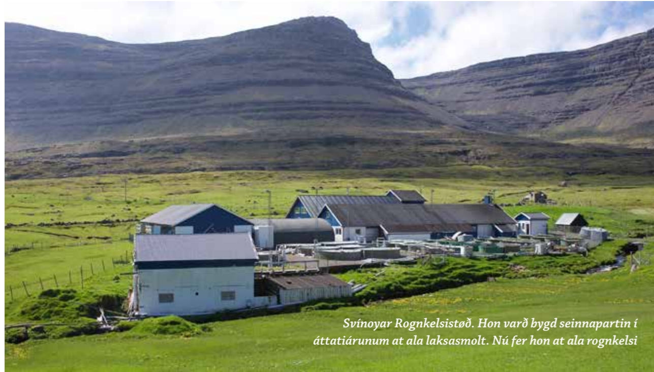
Svínoyar Rognkelsistöð. Hon varð bygd seinnapartin í áttatiárunum at ala laksasmolt. Nú fer hon at ala rognkelsi