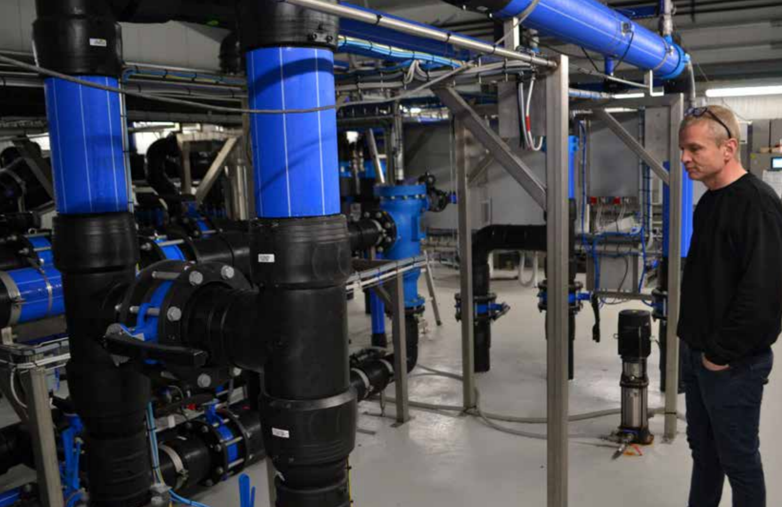
Ein stórir partur av arbeiðinum hjá maskinmeistarunum er at fylgja við pumpuskipanum til alikørlini

goymslubrunnarnar. Á veg í brunnarnar fer vatnið eisini í eina sentrifugu, sum sentrifugerar sand frá, um tað til dømis hevur verið áarføri. Reinsitilgondin hevur eisini til endamáls at tryggja, at eingin sjúka kemur inn á verkið við vatninum.