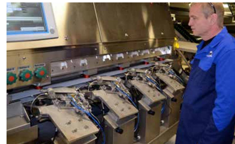
Tvær koppsetingarmaskinur hava avloyst eini 12–14 fólk. Eini 18.000 smolt verða koppsett um tíman við báðum koppsetingarmaskinunum á støðini