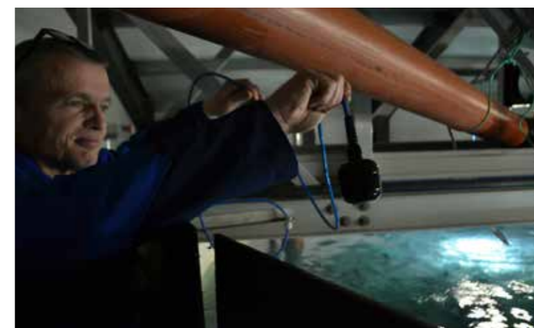
Ein iltsensorur er í hvørjum kari, meðan aðrir sensorar eru savnaðir í mátistøðum