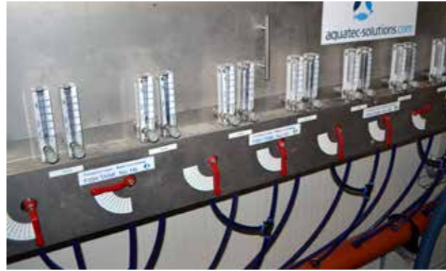
Ein av mátistøðunum, sum fylgir við í fleiri kørum

Men maskinmeistararnir taka eisini eina hond í, tá aðrar uppgávur eru, eitt nú tá fiskur skal flytast, tá mugu øll hjálpa.