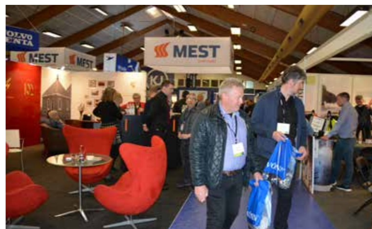
Nógv fólk vitjaðu Fish Fair 2019, har 190 feløg úr 20 londum vóru umboðað