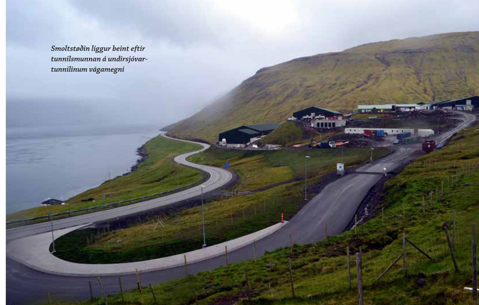
Smoltstøðin liggur beint eftir tunnilmunnan á undirsjóvar-tunnilinum vágamegni