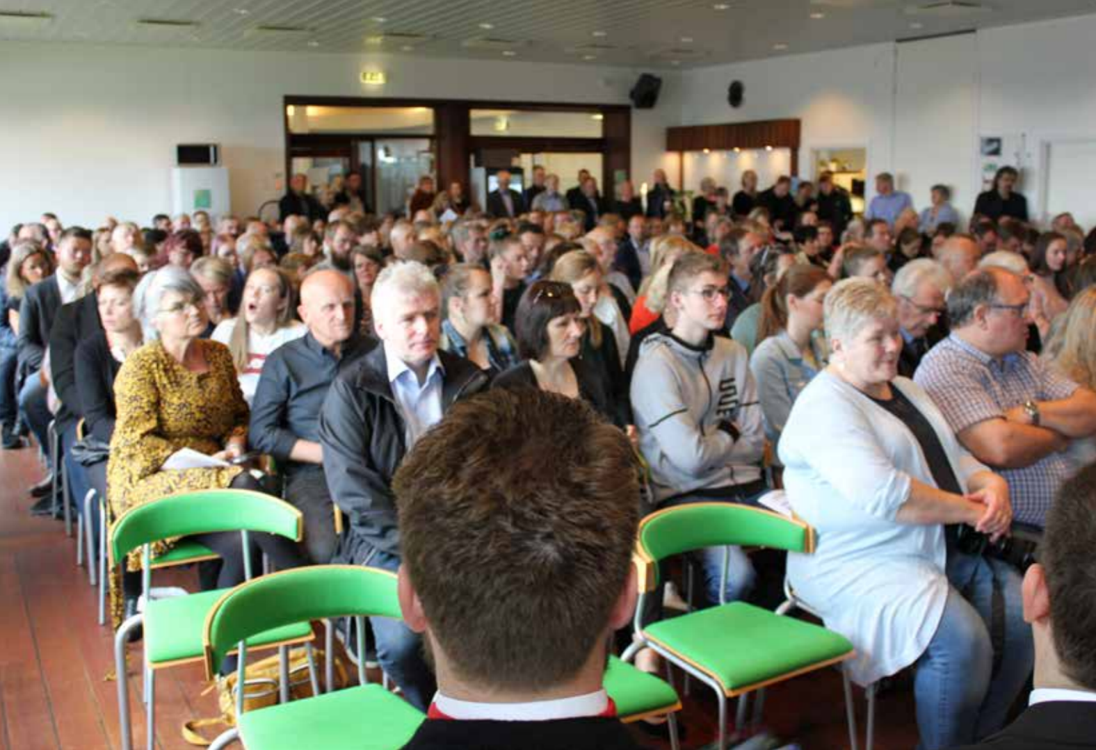
Sum alltið var stúgvandi fult av fólki komið saman í Skálanum á Vinnuháskúlanum at heiðra nýggju maskinmeistararnar, skipsførararnar og skipararnar